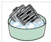
焦げ付きはお湯で ふやかして、台所用洗剤 で洗いましょう。

温めてから使うと汚れ がつきにくくなります。 油汚れは時間が経つほど 落ちにくく、最終的に 使わなくなることに。