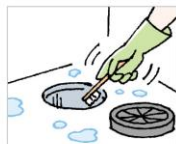
排水口の内側の ヌメリも落とします。