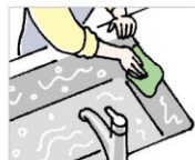
台所用洗剤で洗って 布巾で拭き上げます。

汚れや水分を残すとカビや 雑菌が繁殖し、いやな匂い の原因になります。使う前に 水を流すと汚れがつきにく くなりますよ。