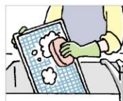
取り外せる部分は 台所用洗剤を溶かした お湯につけ置きして。

ひどい汚れは換気能力 が低下しお部屋に煙や 匂いが充満することも。 半年に一度はきちんと お手入れを。