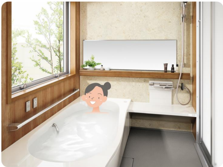
リフォームで、今より幅も奥行も5cm広げることができます。浴槽もワンサイズアップ。