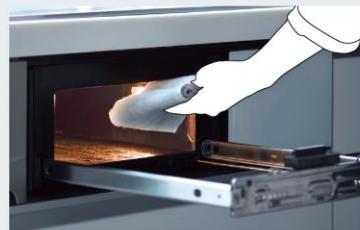
IH&遠赤ラックキンググリル