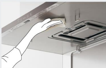
全自動おそうじファン付*3 ほっとクリーンフード

*1 10年間使用してもファンの汚れは当社従来品(S73AHZ3F2)の1年分しかたまりません。 一般財団法人ベターリビング優良住宅部品評価基準換気ユニットのフィルターの油捕集効率試験での値。 *2 10年使用相当の汚れ付着での基本性能試験の値(当社調べ)。 *3 ファンは10年に1回、プレートは1年に1回のお手入れが必要です。使用状況によりお手入れ頻度は変わります。