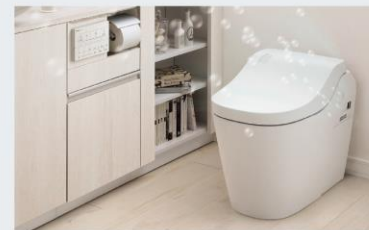
アラウーノL150シリーズ

泡で洗って、除菌*1、消臭*2まで全自動だから汚れにだけでなく、ニオイもキレイ。