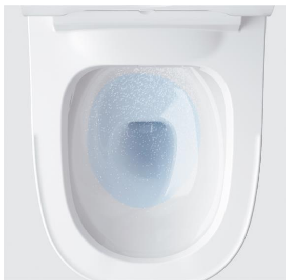
水アカと汚れのつきにくいスゴピカ素材で ツルンとキレイなトイレをキープ