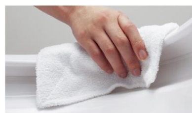
スキマや段差がほとんどないので ふき掃除がラクラク