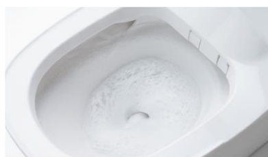
洗剤の泡と勢いのある水流で 流すたびに便器内をしっかりおそうじ

いまどきのトイレは自動で洗浄・汚れをガードし、ニオイもスッキリ。毎日おそうじしなくても、清潔感を保ちます。