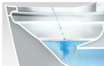
洗剤の泡がクッションになって トビハネを抑えるから床が汚れにくい